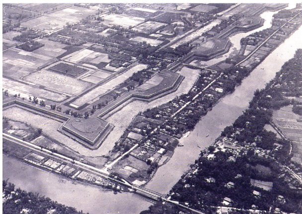
Vue aérienne de Hué avant-guerre

Classé Patrimoine mondial de l'humanité par l'Unesco, Hué symbolise l'histoire, la poésie, la littérature, une brillante vie culturelle. Cependant, au cours de son histoire récente, la ville a souffert de graves dégâts causés par le feu, le climat tropical, la végétation et les attaques de termites.